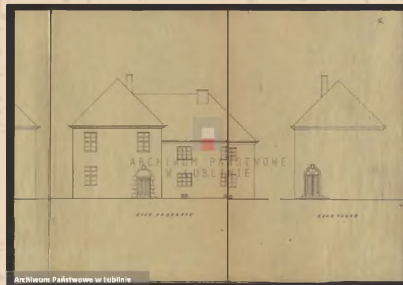
Archiwum Państwowe w Lublinie