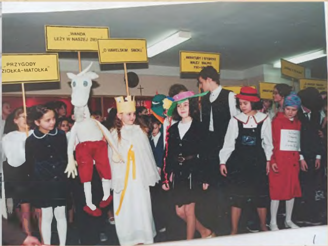
Program artystyczny o twórczości Kornela Makuszyńskiego